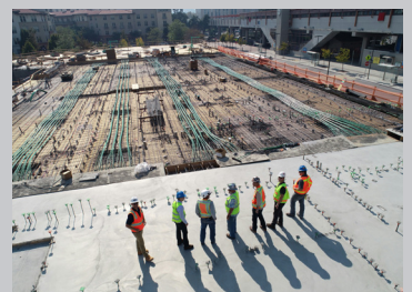
건설 건설 현장의 매핑 및 관리