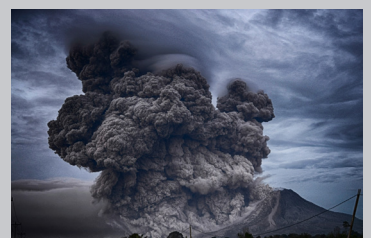
재해 관리 재해 발생 지역에서의 신속한 매핑 및 지원