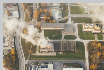
환경 모니터링 환경 변화 관찰 및 추적